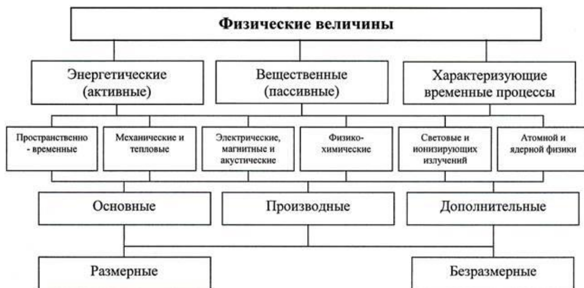
Рис. 1.2. Классификация физических величин

Для более детального изучения ФВ необходимо классифицировать (рис. 1.2) и выявить общие метрологические особенности их отдельных групп.