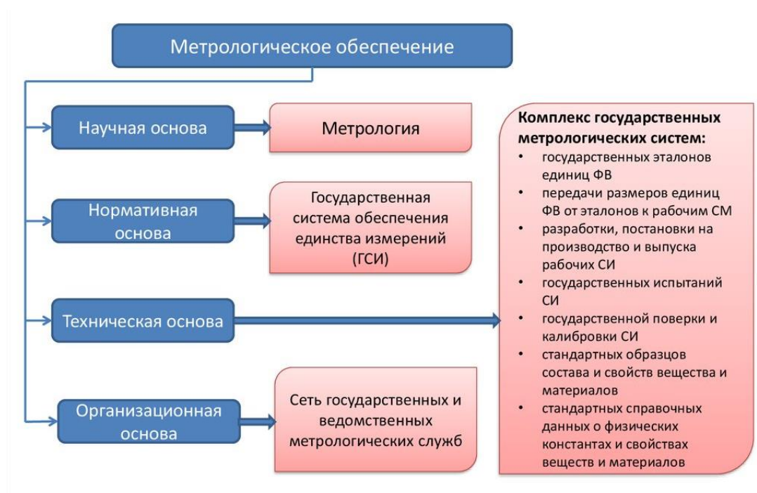
Рис. 3.1 Структура метрологического обеспечения

подразумеваемая при этом МО измерений (испытаний или контроля) в данном процессе, производстве, организации. На рисунке 3.1. приведена структура метрологического обеспечения.